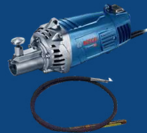
VIBRADOR DE CONCRETO